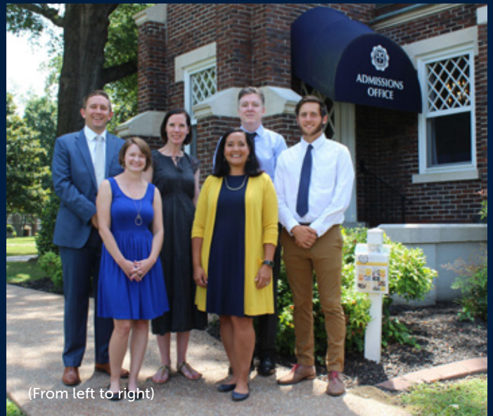
(From left to right)

请拨打招生办电话+1 (931) 389-6003 或通过下述电邮来了解更多细节