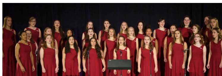
学生生活 STUDENT LIFE