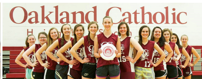
学生生活 STUDENT LIFE