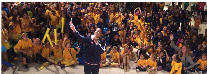
学生生活 STUDENT LIFE