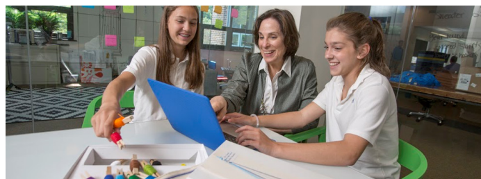
学生生活 STUDENT LIFE